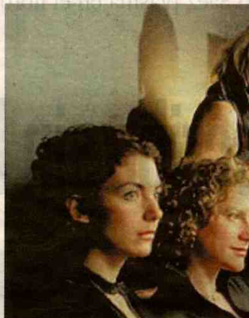
Edison Woods, uno de los muchos atractivos d